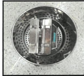
(시험체 설치 모습)