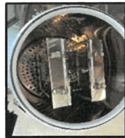
(시험체 설치 모습)