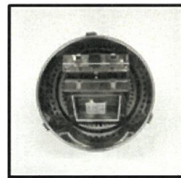
(시험체 설치 모습)