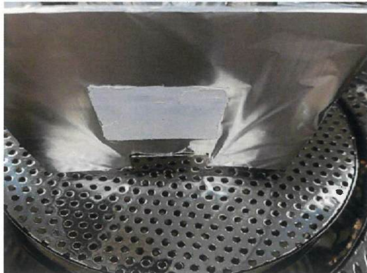
챔버 설치 전 사진